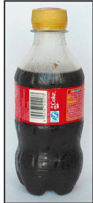
PEF of PET?